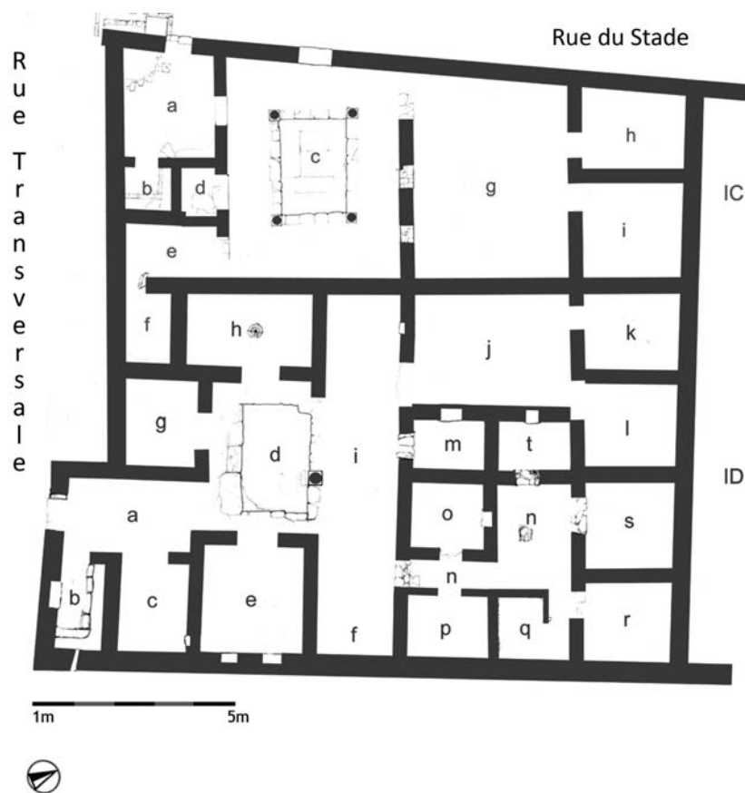
Fig. 16 — Plan des Maisons IC et ID, phase 2 (dessin M. Zarmakoupi).

elle fournit un accès aisé à la nouvelle entrée (a) dans sa phase ultérieure. De cette façon, l'espace réservé au passage est concentré dans le secteur ouest de la maison – du vestibule (a) à la cour (c), puis aux trois salles (g), (h) et (i) 67 .