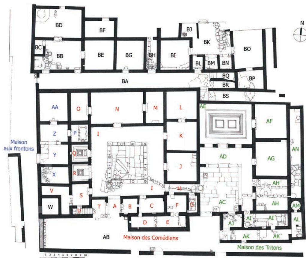
Fig. 18 — Plan de l'îlot de la Maison des Comédiens (dessin M. Zarmakoupi).

une partie des espaces originellement publics. Dans le cas de la Maison des Tritons et de la Maison des Comédiens du Quartier Nord (fig. 18), les pièces (AI-AI') et les pièces (D) et (E) ont été ajoutées pour aménager un lieu de stockage 82 . Dans le Quartier du Stade, les espaces de la maison η-θ-θ' ont été agrandis et, par conséquent, ont rogné une partie de la rue. Ces deux extensions ont servi à aménager deux magasins 83 . Dans le Quartier du Théâtre, la partie sud-ouest de la Maison VIH (fig. 17) a été étendue en empiétant sur la maison adjacente et un groupe de quatre salles indépendantes accessibles par une seule entrée a été créé 84 .