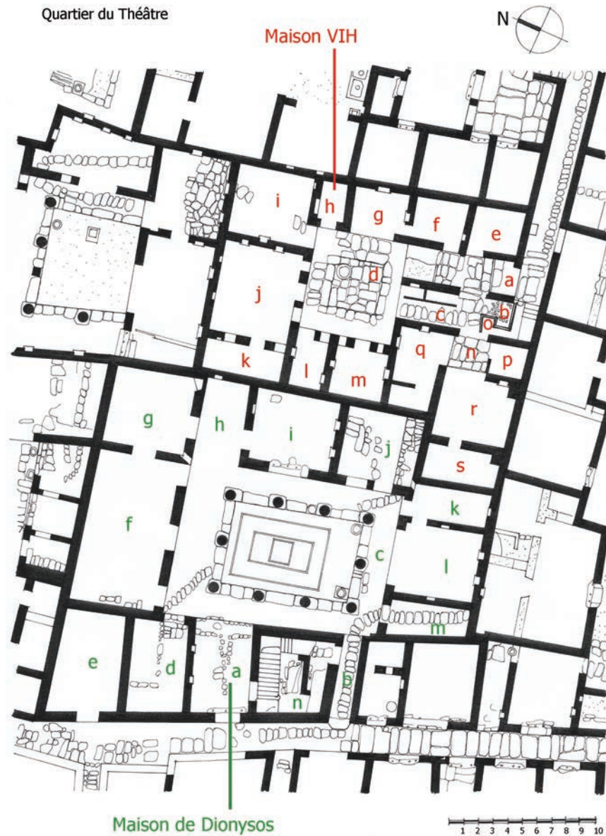
Fig. 17 — Plan de la Maison de Dionysos et de la maison VIH dans le Quartier du Théâtre (dessin M. Zarmakoupi).

quartiers. Cette organisation évolue ensuite pour s'adapter aux besoins particuliers des différentes maisons. Dans le cas de la Maison des Sceaux (fig. 14), les extensions à l'ouest empiètent sur une partie des espaces de la maison adjacente (Maison de l'Épée) ou sur